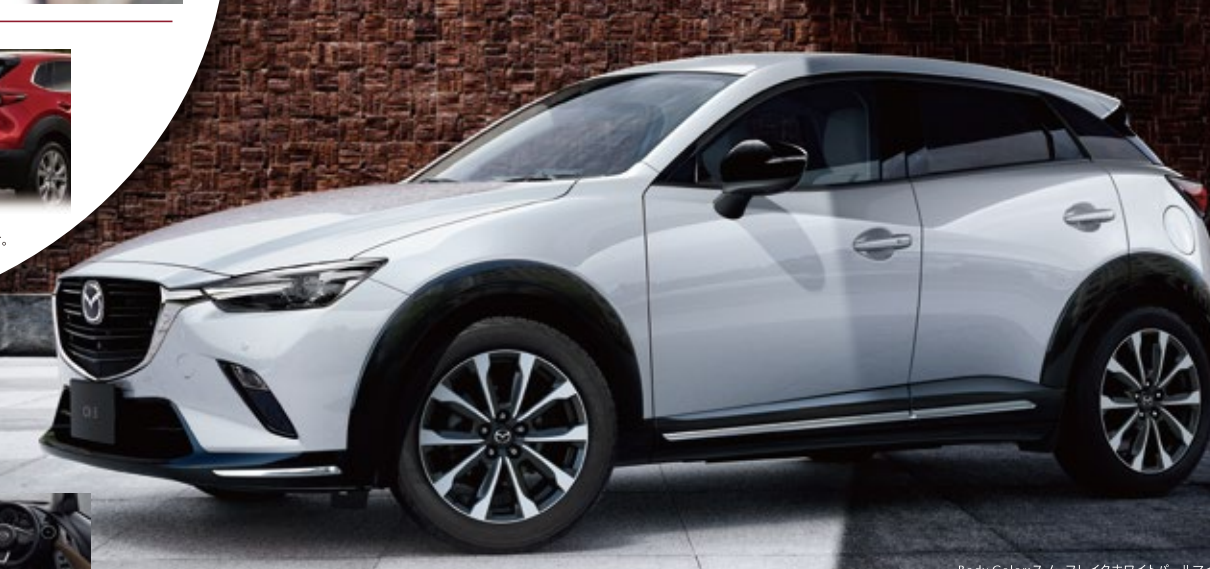
Body Color:スノーホワイトパールマイカ※