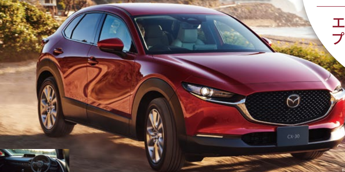
Body Color:ソルレッドクリスタルメタリック※