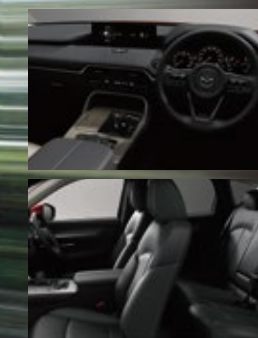
Body Color:ソルレッドクリスタルメタリック※